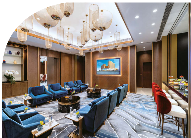
銀河國際會議中心董事會議室

於二零二四年，集團博彩收益總額為411億元，按年上升30%。其中，中場博彩收益總額為331億元，按年上升25%，貴賓廳博彩收益總額為53億元，按年上升55%，角子機博彩收益總額為27億元，按年上升52%。