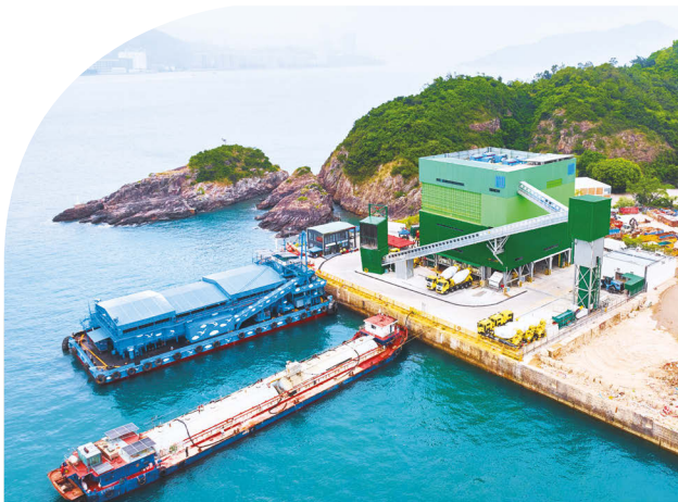
將軍澳137區混凝土廠

中國內地業務持續受到房地產市場及基建投資低迷的不利影響。預計中國大陸的需求在短期內仍將繼續受壓。