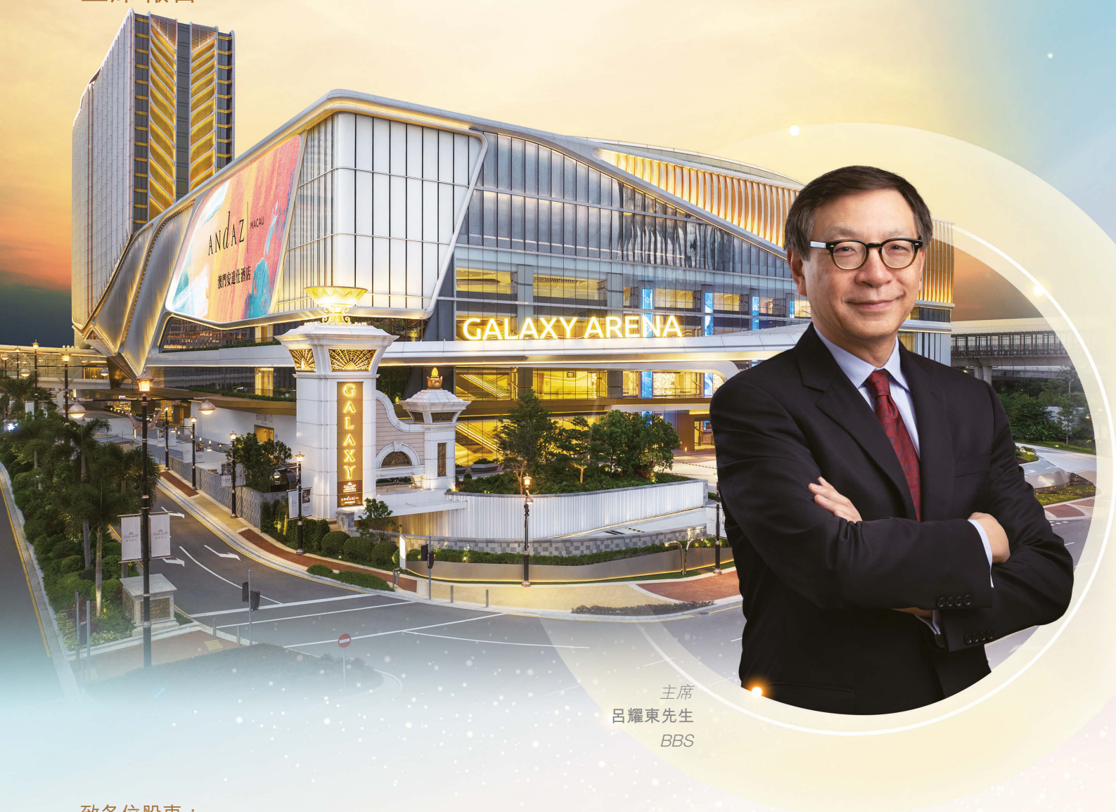
主席 呂耀東先生 BBS