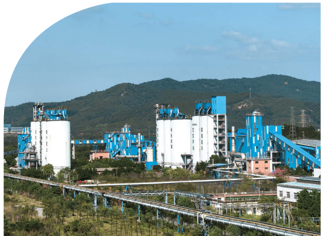
廣東韶鋼嘉羊新型材料有限公司位於廣東省韶關市的礦渣微粉生產廠房